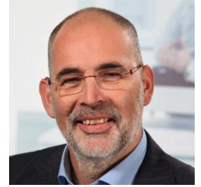
Han Vlieg Planning en Vrijwilligers