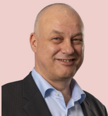
Redacteur: René Schuurman PR & Media